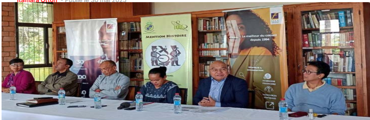
Les chercheurs de la mention histoire de l'université d'Antananarivo et les responsables du cabinet FTHM Consulting.

Les 3 et 4 juin prochains, la Cité des Cultures Antaninarenina sera le théâtre d'un colloque consacré à l'histoire économique de Madagascar, s'étendant sur 1 300 ans.