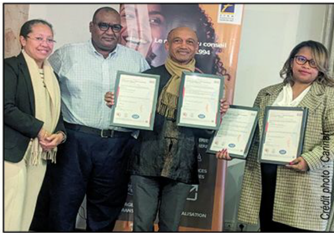
Lors de la cérémonie de la remise officielle du certificat, jeudi dernier à Antananarivo