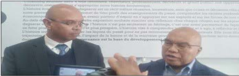
Lors de la conférence de presse qui s'est tenue hier à Antaninarenina