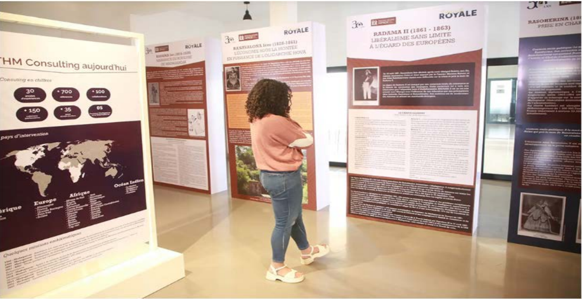
L'exposition à la Cité des Cultures durera un mois et est ouverte au grand public.