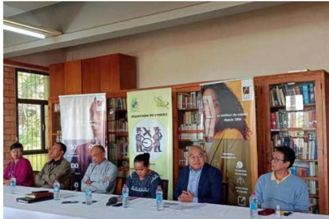
Les chercheurs de la mention histoire de l'université d'An- tananarivo et les responsables du cabinet FT4M Consulting.